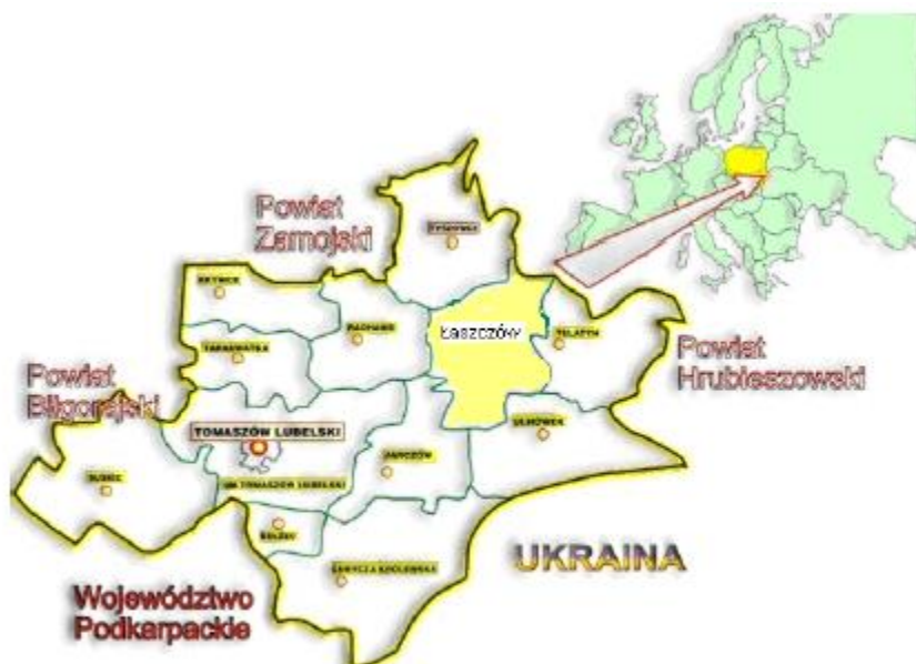
Gmina Łaszczów na tle powiatu tomaszowskiego

Gmina Łaszczów to gmina miejsko-wiejska. Należy do województwa lubelskiego , powiatu tomaszowskiego . Gmina Łaszczów ma 6 219 mieszkańców, czyli zamieszkuje ją 7,3% ludności powiatu. Gmina stanowi 8,6% powierzchni powiatu. Siedzibą gminy jest miasto Łaszczów . dane http://www.polskawliczbach.pl/gmina